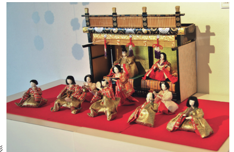
展示されたひな人形

ふるさと博物館で「第10回 ひなに魅せられて～ひな人形の世界～」が開催されました。会期中は、新型コロナウイルス対策を取りながらの開催となりました。同博物館では、日本古来のひなまつりを紹介しながら、市内各家で大切に受け継がれてきたおひなさまや特色あるおひなさまなど150組約500体を、所蔵している古い民具などと共に展示をしました。