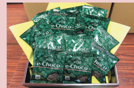
寄贈されたチョコレート