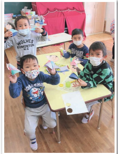
友達と作ったお内裏様とお雛様、みんなよくできました。