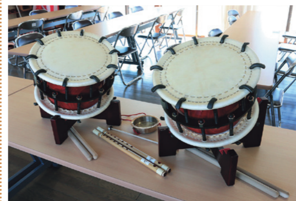
整備した附締太鼓

この助成事業は、宝くじの社会貢献広報事業として、コミュニティ活動に必要な施設や備品の整備を行うものです。原北自治会では、公民館を中心にした活動を通じて、地域の繋がりや地域住民のコミュニティの更なる発展と充実が期待されます。