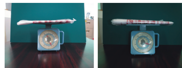
左：従来品 右：現行品(軽くなっています)

※従来品よりも強く伸びにくい素材ですので、無理やり伸ばそうとすると破けることがあります(従来品も同じ力を加えれば破けます)。ごみ袋は、詰め放題の袋ではありません。無理のないごみの排出をお願いします。