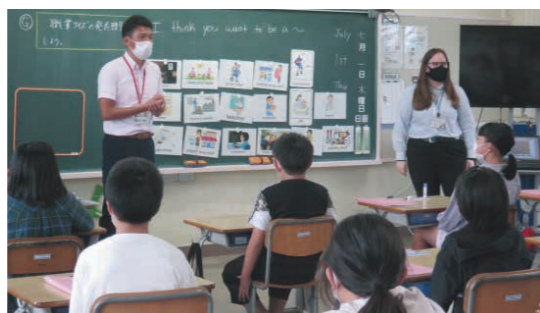
外国人英語指導助手による英語授業の様子

外国人英語指導助手派遣事業は、小中学校における外国語教育の改善・充実および国際教育の充実を図ることを目的としています。