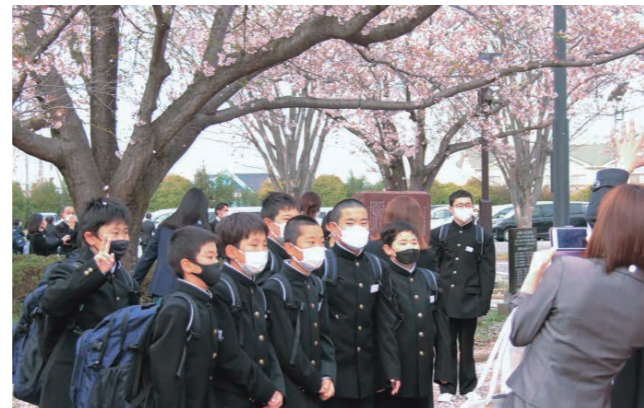
桜の下で記念撮影（千代川中）