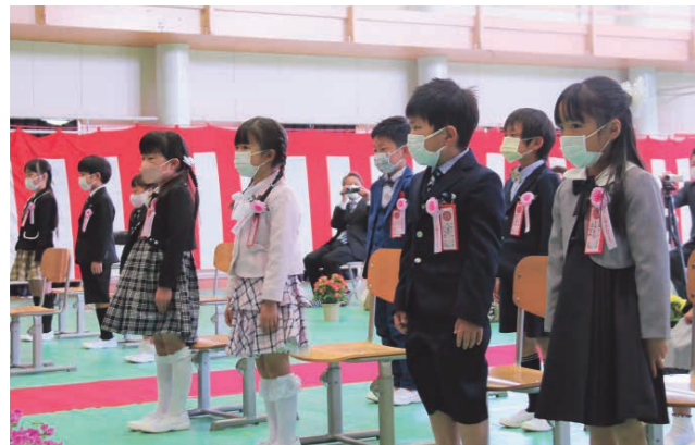
呼名され起立する新入生（豊加美小）