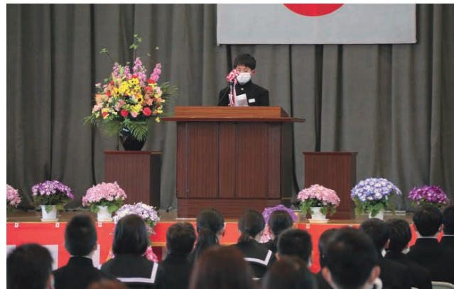
新入生代表による「誓いの言葉」（千代川中）

市内小中学校で入学式が開催され、9小学校で324人、3中学校で348人の新1年生が、満開の桜の下、それぞれの校門をくぐりました。各校では、今年も参加人数を制限するなどして、新型コロナウイルス対策を取りながらの入学式となりました。取材をした豊加美小学校や千代川中学校では、新入生たちが緊張の面持ちで式に臨んでいました。