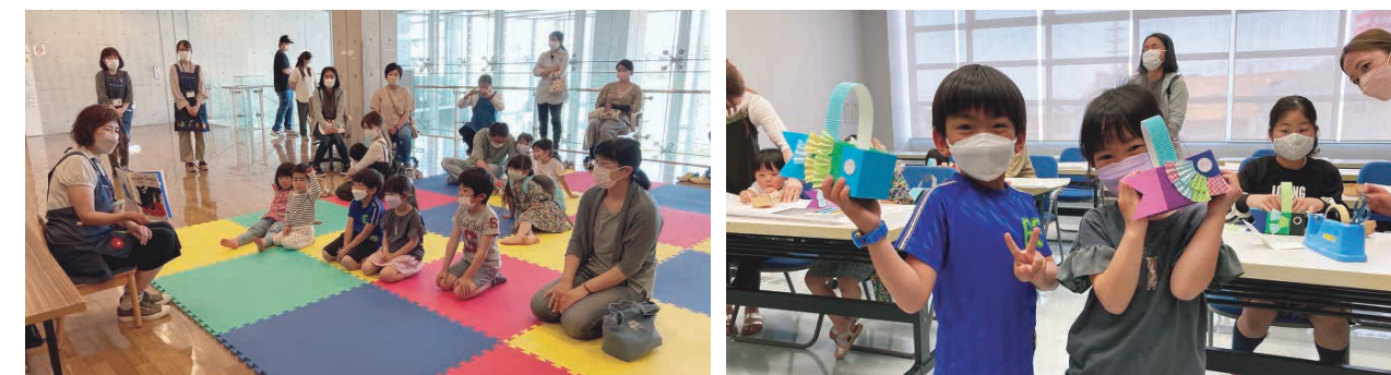
読み聞かせや、工作を楽しむ参加者

5月5日、市立図書館で「こどもの日おたのしみおはなし会」を開催しました。当日は、事前申し込みの親子など9組が参加し、図書館職員による絵本の読み聞かせや紙芝居、親子による「鯉のぼりの小物入れ」の工作などを楽しみました。