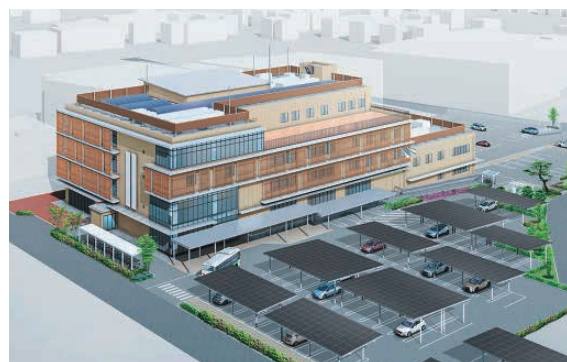
新庁舎完成予想図