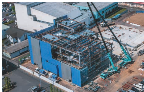
建設中の新庁舎（5月25日撮影）

令和5年5月の開庁に向けて建設中の市役所新庁舎ですが、現在は鉄骨工事を進めています。工事の状況は市ホームページでも随時お知らせしていきます。なお、新庁舎はNearly ZEB(※)の認証を目指しています。 ※省エネにより建物で消費するエネルギーを50%以上削減した上で、更に再生可能エネルギーの活用などによる創エネにより、消費エネルギーを75%以上削減する建物を指します。