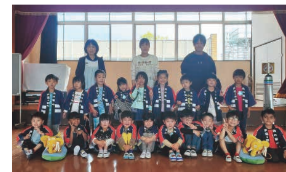
お揃いの纏を着るそら組の園児たち

ちよかわ幼稚園幼年消防クラブは平成16年4月に結成されました。このクラブは、子ども達が、火に対する正しい知識を得るなど、未来の社会人としての下地を身に付けてもらうことを目的としています。新型コロナウイルスの影響で令和2、3年度は入団式を自粛していましたが、今回3年ぶりの開催となりました。入団した「そら組」(年長)の19人は、防火の誓いを全員で宣言していました。