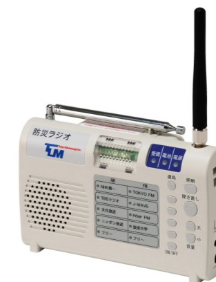
280メガヘルツ防災ラジオ(デジタル)