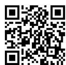
ネットワークしもつま (市ホームページ内)

◎「チャレンジいばらき県民運動」については、ホームページ( https://challenge-ibaraki.jp/ )をご覧ください。