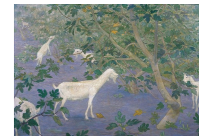
《無花果畑》 1912年 水戸市立博物館蔵

○WEB予約をおすすめします。 当館ホームページで「日時指定WEB整理券」(無料)を取得された方が優先入場となります。