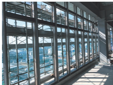
(下) 4階展望スペース