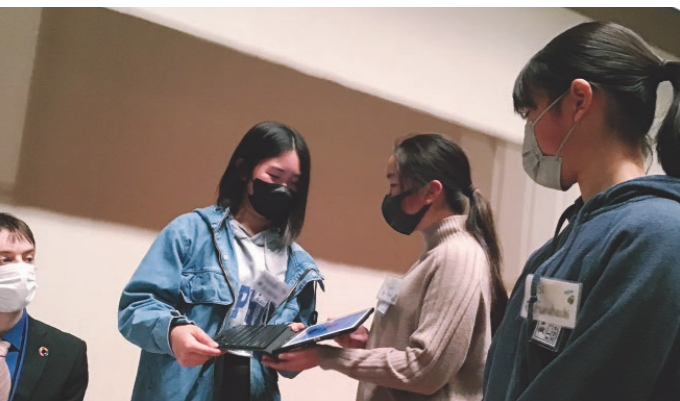
小中合同英語フォーラム(大形小学校)

令和2年度から一人一台端末を活用して、オンライン英語交流を行っています。令和3年度は市立3中学校の生徒が、台湾の中学生と交流しました。プレゼンテーションを通して学校生活について紹介し合った後、ポップカルチャーなどについてやり取りをしました。好きな歌手に話題が及ぶと双方から歓声があがり、笑顔になる場面が見られました。今年度は新規事業として、騰波ノ江小学校と総上小学校の6年生が大子町立小学校の5・6年生と交流します。中学校は、昨年度に引き続き、台湾の中学生との交流を予定しています。