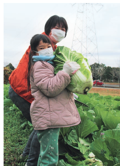
白菜を収穫する親子

ビオスパークしもつまふれあい体験農園で栽培されている白菜やほうれん草を収穫して農業体験をしてもらうイベントが開催され、親子連れなど28人が参加し、大きく育った白菜を収穫していました。このイベントは下妻地域ふるさと交流推進協議会が主催し、市内の