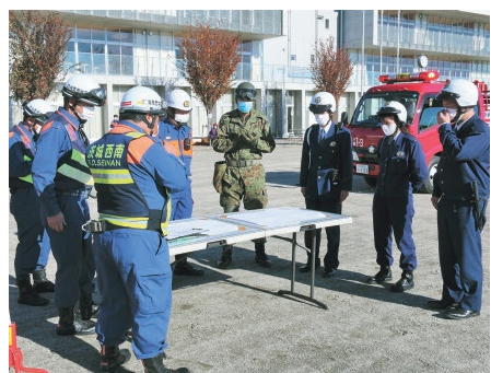
消防・警察・自衛隊による情報収集訓練