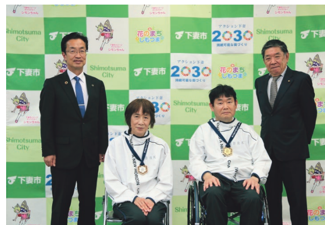
左から菊池市長、山口さん、本橋さん、廣瀬市議会議長