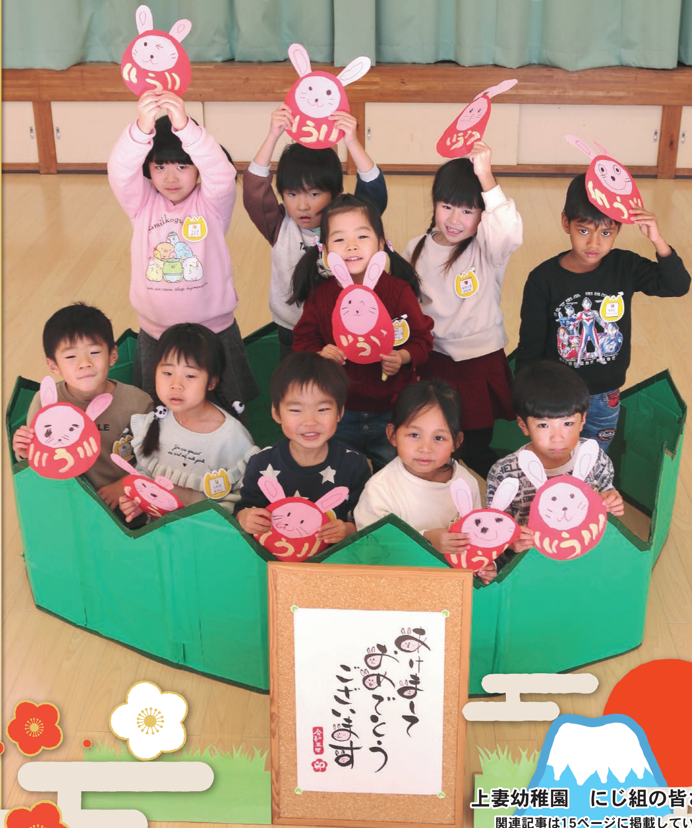
上妻幼稚園 にじ組の皆さん 関連記事は15ページに掲載しています。