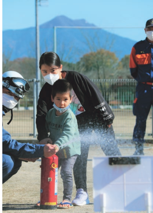
水消火器による消火体験を行う児童

3年ぶりの開催となった訓練では、大規模災害が発生したと想定し、消防、警察、自衛隊による連携の確認、負傷者が発生したとされた現場での人命救助訓練やトリアージ訓練、ドローンを使った情報収集訓練や中学校屋上からの救出訓練、放水訓練、炊き出し訓練を実施しました。また、体験コーナーでは、来場した家族らが消火器を使った消火の訓練などを体験しました。