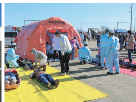
消防・医師会によるトリアージの実施訓練