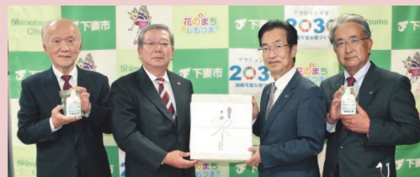
左から坂入副会長、須藤会長、菊池市長、塙副会長