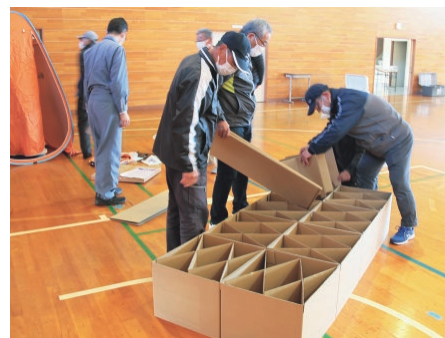
自治区住民らによる段ボールベッドの作成訓練