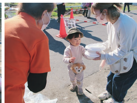
自衛隊のカレーライスを受け取る参加者