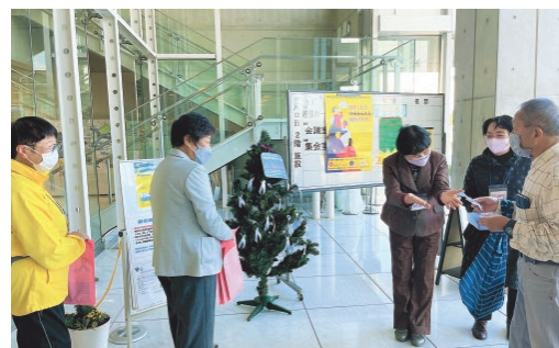
市立図書館でキャンペーンを行う参加者