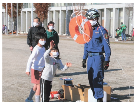
浮き輪などを要救助者に投げる体験をする児童