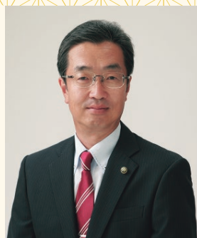
下妻市長 菊池 博

ウイルス感染症の終息、ウクライナ情勢の一日も早い和平を願わずにはいられません。 引き続き、コロナ禍における各種対策事業、支援事業を継続し、本年も市民に寄り添った市政運営に努めてまいります。