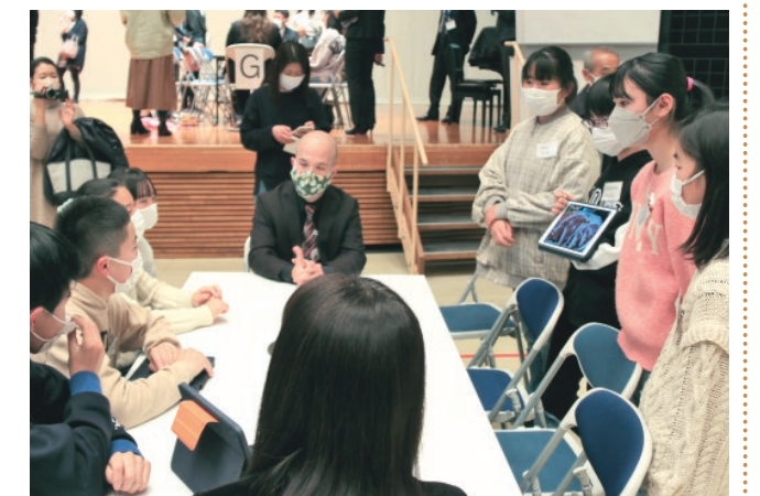
ALT(中央)の進行のもと、プレゼンテーションを行ったチーム(右)に質問する小学生(左)