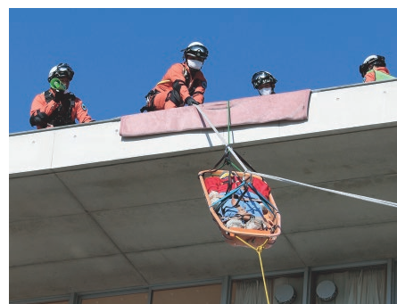
消防隊員による屋上からの救助訓練