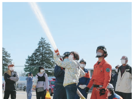
消防署員の指導により放水訓練を行う参加者