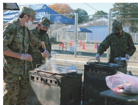
炊き出しを準備する自衛隊員