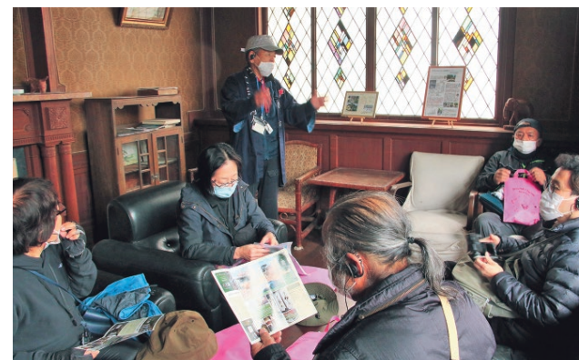
六芳園で説明を聞く参加者

砂沼周辺の史跡や仏閣をウォーキングで散策するイベントが開催され、冷たい雨の中、参加者らは下妻の歴史に思いを馳せました。イベントでは、下妻いいとこ案内人の会会員の案内により光明寺、円福寺、金林寺、六芳園（沼尻家住宅）などを巡りました。東京都立川市から参加した男性は「下妻には初めて来ました。建物に興味があって参加しました。詳しく解説してもらえて良かったです」と話していました。また、ウォーキング終了後には六芳園で県西ギターサークル「こもれび」のコンサートを楽しみました。