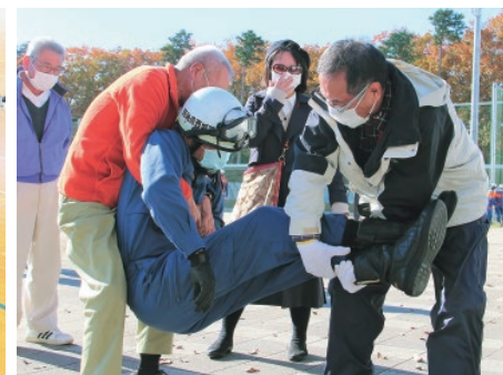
自治区住民らによる搬送訓練