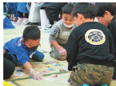
熱戦が繰り広げられました

このイベントは、市民団体「STOP! 温暖化エコネットしもつま」の主催で、イオンモールしもつまを会場に開催されました。参加者は市内在住の年長クラスの年齢の未就学児・幼稚園・保育園の園児で、20人10組のチームがトーナメント戦を戦いました。しもつま環境カルタは、市民参加により平成21年度に制作されたもので、環境保全をテーマに公募した標語や市内中学生が描いた標語に基づいた絵で構成されています。環境カルタは、市HPからダウンロードできます。