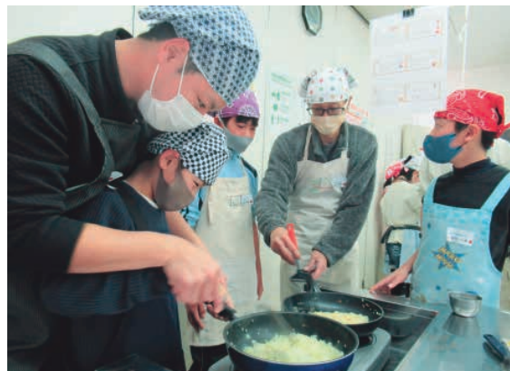
食材を炒める参加者

また、参加した父子は協力しながら調理し、「餡色になるまで玉葱を炒めるのが難しい」「カレーのスパイスを初めて知った」「楽しかった。また作りたい」と話していました。