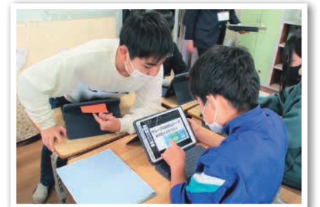
タブレット端末を使い調査発表資料を作る児童

高道祖小学校では、3～6年生が「高道祖から未来の社会へ ～ぼくのわたしのSDGs～」を合言葉に、探究活動を行っています。自分で決めた「地域」「福祉」「環境」「よりよい未来社会」などをテーマに、地域の専門家の話を聞く、実際に現地を訪れるなど、体験的な学習を積み重ねました。今後も、持続可能な社会の担い手となる児童に対し、自ら課題を見つけ、他者と協働し持続可能な社会づくりを目指す活動を続けていきます。