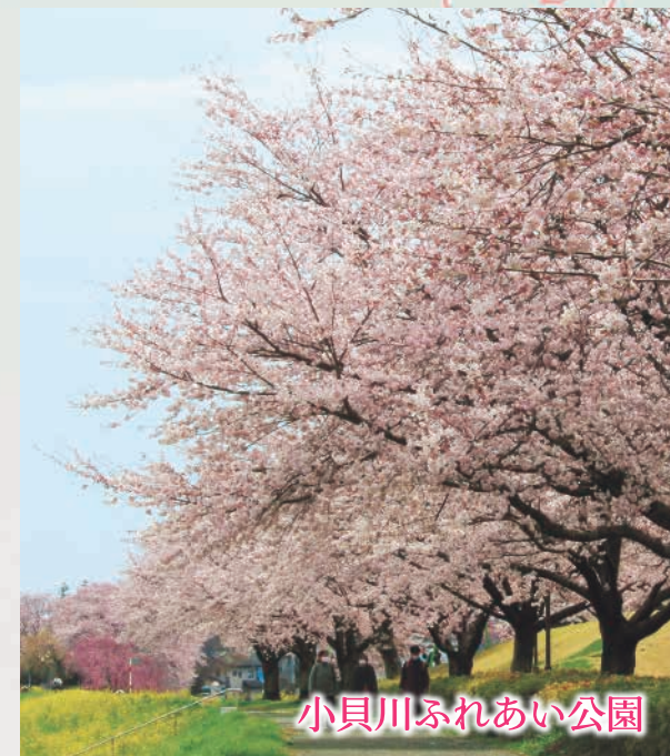
小貝川ふれあい公園