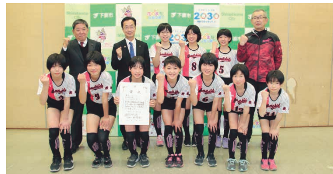
表敬訪問のため市役所を訪れたスマイルキッズスポーツ少年団の皆さん