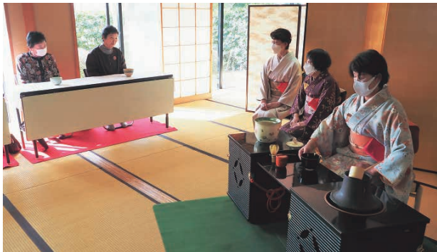
茶道を体験する参加者

2月18日、19日の2日間、第23回公民館まつりが千代川公民館で開催され、約1300人が来場しました。まつりには市内の各公民館教室や利用団体など31団体が参加し、日頃の活動の成果を展示しました。また会場では、筆ペン習字やつるし雛、手編みなどの体験コーナーが設けられ、来場者が手ほどきを受けながら楽しんでいました。作品を展示した女性は「披露できる機会があることは、モチベーションが上がります。みなさんと交流でき楽しいです」と話していました。