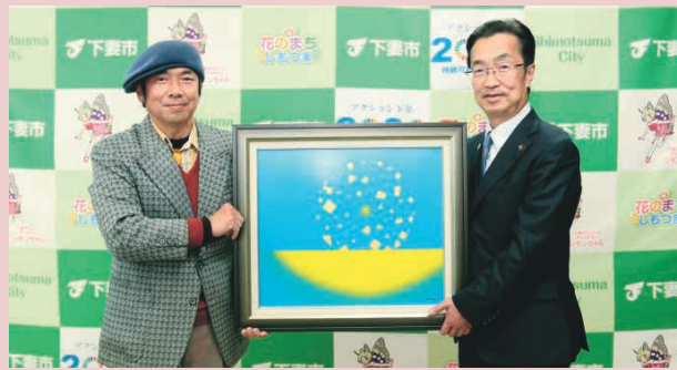
作品を寄贈する浅野さん(左)と菊池市長(右)