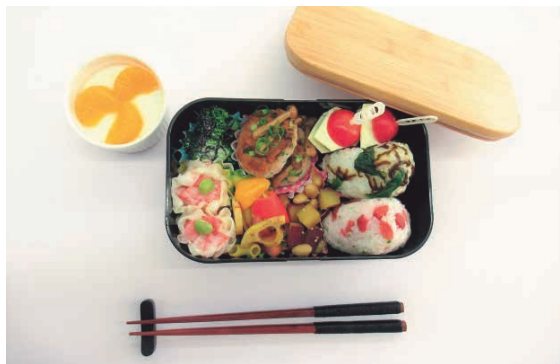
大里さんの思いがこもった手作り弁当