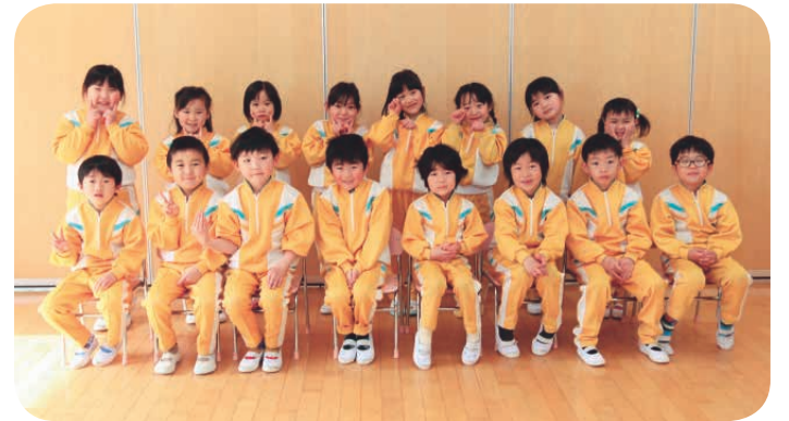
◀ひまわり組の皆さん