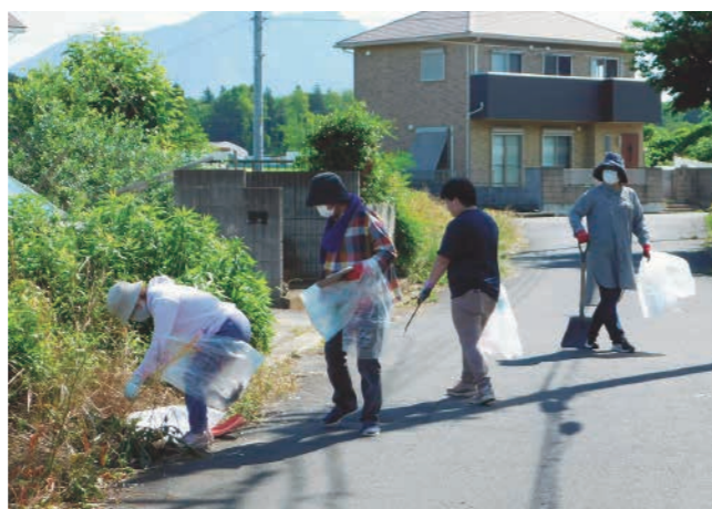
ごみ拾いを行う参加者

ご参加いただいた皆様、誠にありがとうございました。これからも、きれいなまちづくりの推進にご協力をお願いします。