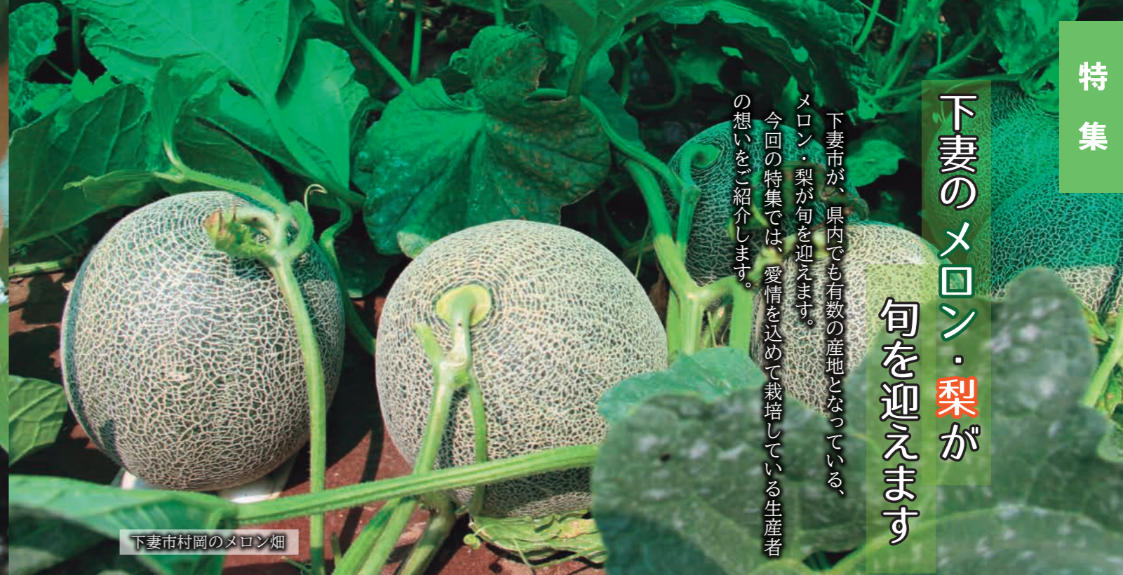
下妻市村岡のメロン畑