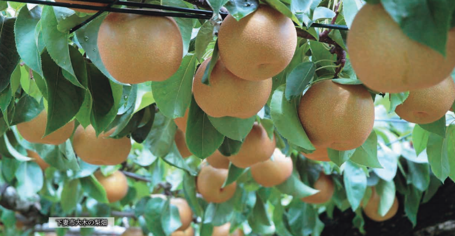
下妻市大木の梨畑

下妻市が、県内でも有数の産地となっている、メロン・梨が旬を迎えます。今回の特集では、愛情を込めて栽培している生産者の想いをご紹介します。