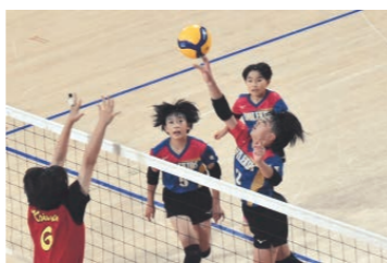
全国大会で活躍するスマイルキッズ