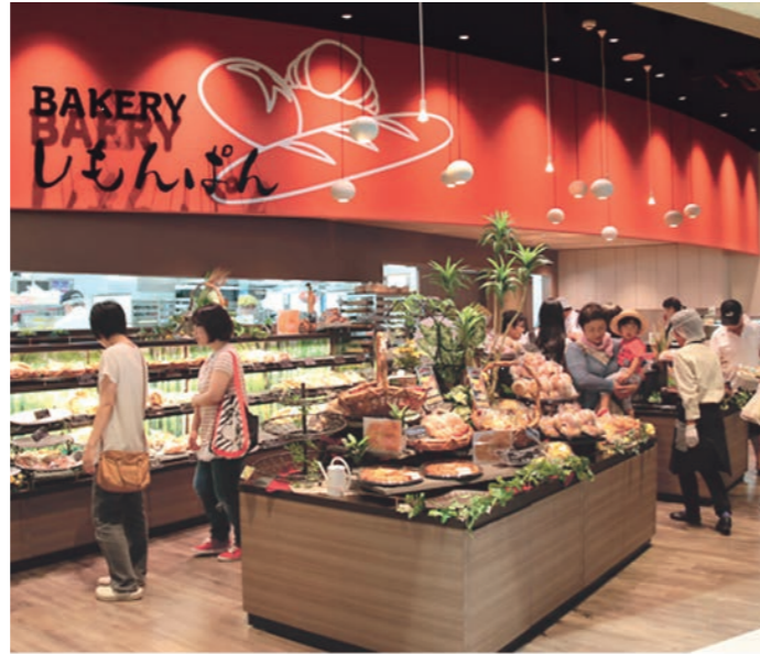
好評の道の駅しもつま「BAKERY（ベーカリー）しもんぱん」