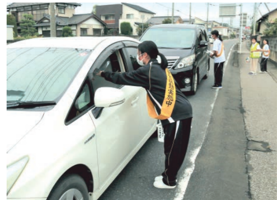
朝の通勤者に対し、啓発品を配布する下妻第一高等学校の生徒（本宿交差点）