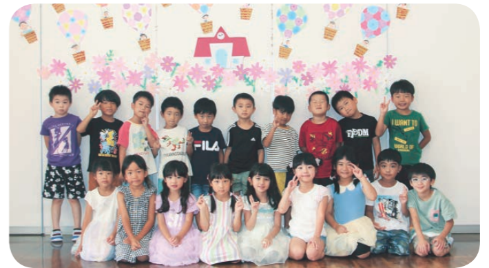
◀めろん組の皆さん

自分の絵を描きカゴに乗せると、「どこまでも飛びそう」「どこまでいけるかな」とワクワクしていた子どもたちです。こんな気球に乗って大空を散歩してみたいですね♪