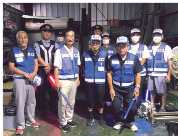
小野子町内防犯パトロール隊のみなさん →