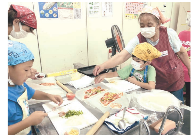
家族で協力しながら、ピザ作り