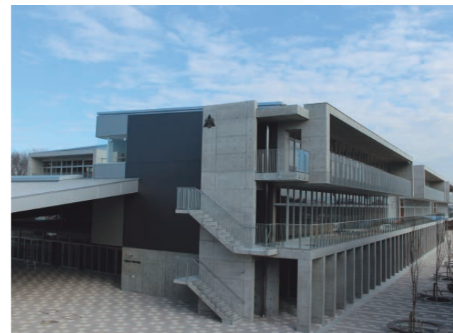
写真は下妻中学校：本文とは直接関係ありません

全国的な少子化の進展に伴い、本市でも市立小中学校の児童生徒数が大幅に減少しています。今後も同様の傾向が続くことが予測されることから、将来を見据えた学校規模の適正化について検討していく必要があります。