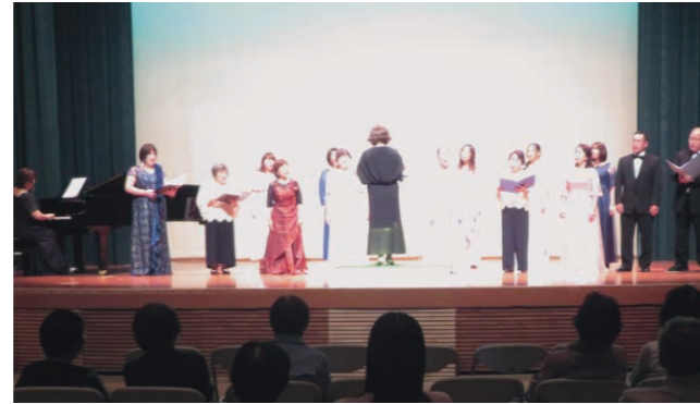
千代川公民館での発表風景