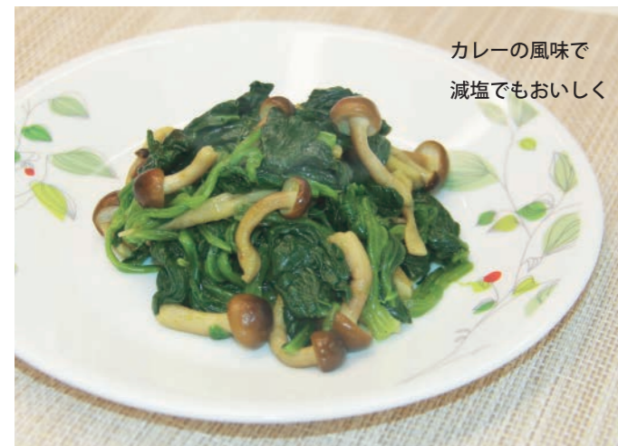
カレーの風味で 減塩でもおいしく