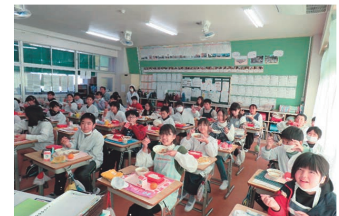
下妻小学校での給食の様子（写真は令和4年に撮影したもの）