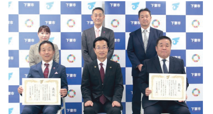
(前列) 左からエスティ ローダー社馬場下妻工場長、菊池市長、工房ウィマム生井社長 (後列) 左からエスティ ローダー社山科さん・秋山さん、工房ウィマム生井専務