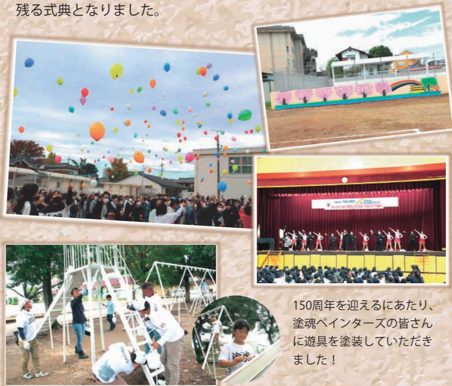
150周年を迎えるにあたり、塗魂ペインターズの皆さんに遊具を塗装していただきました！

11月18日に行われた記念式典では、卒業生からの思い出の講話、地域の下妻AILE吹奏楽団のアンサンブル演奏、大町はやし保存会のお囃子、下妻第一高等学校応援団による演舞、児童たちが作成した壁画の披露、バルーンリリースなどが行われ、思い出に残る式典となりました。