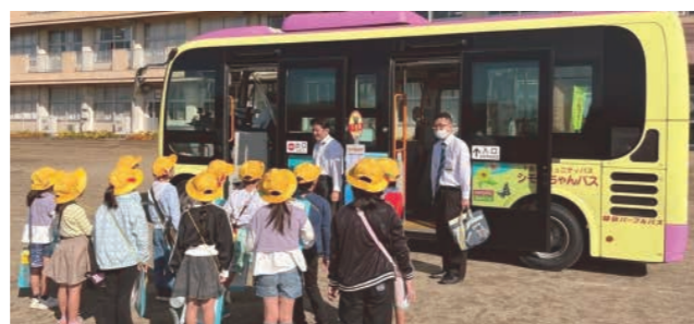
豊加美小学校でのバスの乗り方教室 (10月13日)

今後も公共交通の利用促進に向けて、バスの乗り方教室を含めたモビリティマネジメント事業を実施してまいります。 ☎ 企画課