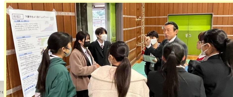
探究成果発表会の様子

「茨城県のSDGs」をテーマに発表した生徒からは、「県内の自治体のSDGsの状況について調べてみたが、下妻市のホームページは分かりやすいと思った」との感想が出されました。