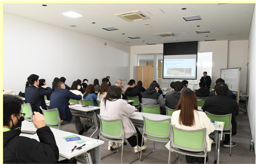
八千代町での研修の様子

カードゲーム「2030SDGs」公認ファシリテータである職員が、講師として八千代町のSDGs職員研修に参加しました。