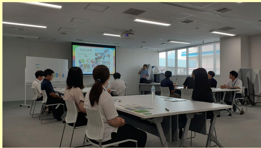
公認ファシリテーターである職員による研修の様子