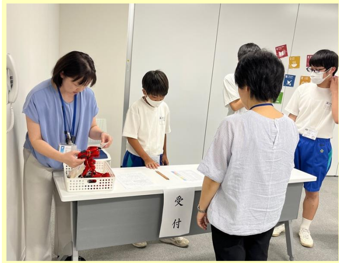
カードゲーム体験会の受付を行いました。