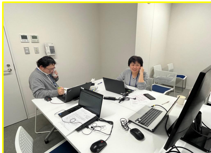
電話でラジオに出演する職員

番組名：ほっとボイス 「CONNECT」内 放送日時：3月26日（火） 17:15～17:25