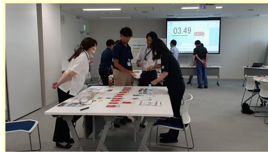
カードゲームに取り組む職員

下妻市では新規採用職員に対し、SDGsへの理解を深めるとともに、それぞれの事業においてSDGsの推進に取り組むため、カードゲーム「2030SDGs」を実施しました！