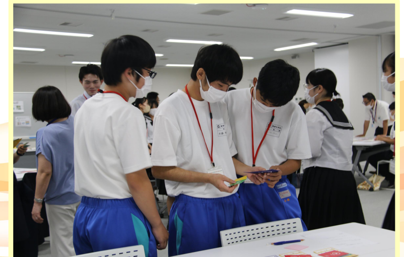
カードゲームに参加する中学生

4人の生徒が市役所の仕事等について、職員から説明を受けた後、SDGsの普及啓発の仕事を体験しました。