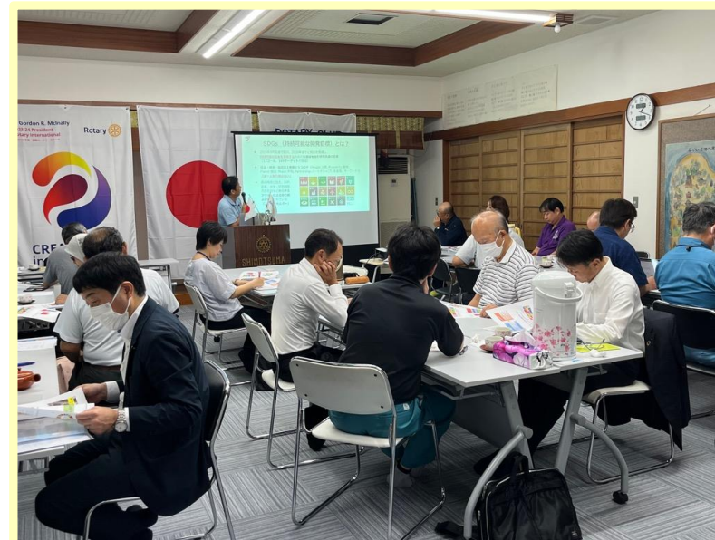
講座を受講している下妻ロータリークラブのみなさん

市ではSDGsに関する理解促進を図るため、2つの出前講座メニューをご用意しております。興味のある方のご利用をお待ちしております。