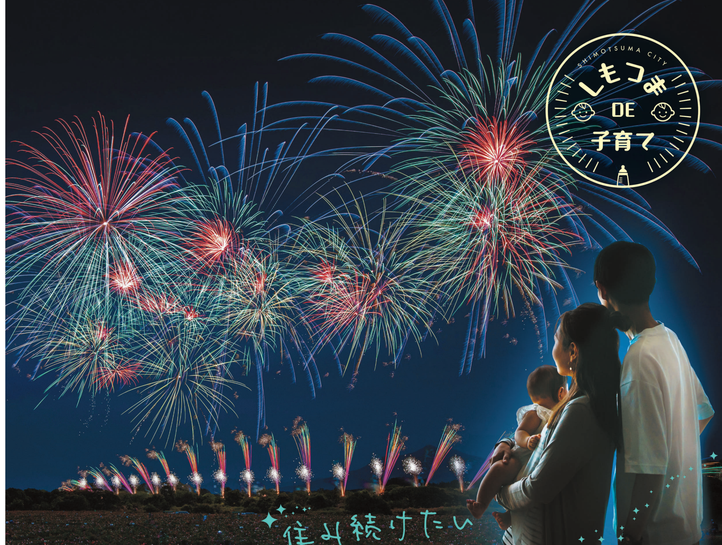
小貝川しもつま花火物語