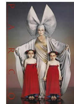
「西洋は東洋を着こなせるか」 PARCO ポスター (1979)

※()内は20人以上の団体料金 ※土曜日は高校生以下無料 ※障害者手帳・指定難病特定医療費受給者証等をご持参の方は無料