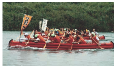
全国Eポート大会 in 鬼怒川 最後まで白熱した試合が見られました