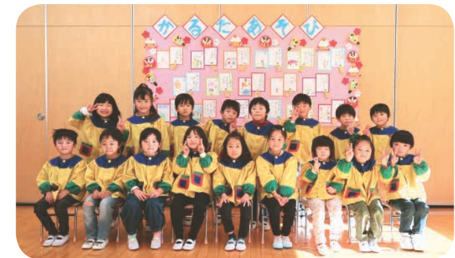
ひまわり組の皆さん

ひまわり組のお友だちは、鬼ごっこ、縄跳び等、体を動かして遊ぶことが好きで、寒さに負けず元気いっぱいです。 少しずつ平仮名の読み書きができるようになってきたお友だち。自分の好きな文字を選び、言葉や絵を考えてオリジナルカルタ作りをしました。子どもらしい可愛い、そして面白い発想がたくさん作品になりました。