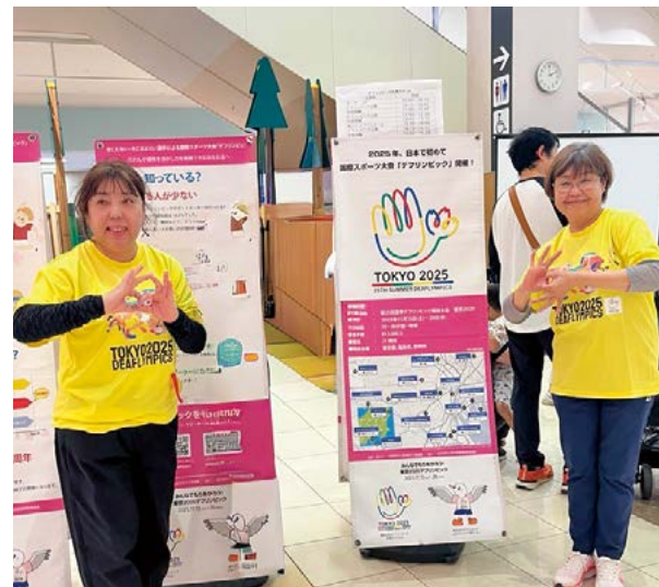
「デフリンピック」を表す手話ポーズ