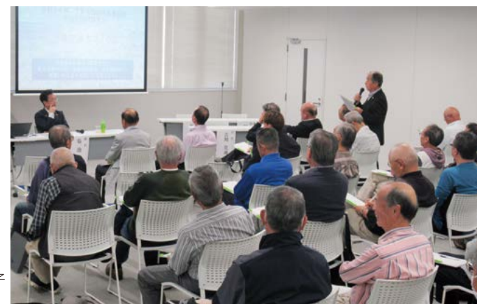
(上) 千代川会場での様子