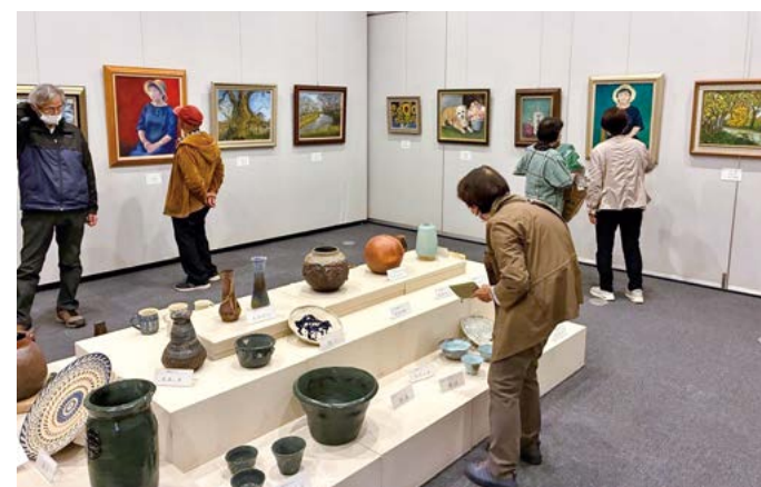
(上) 発表部門：ひびきコンサート (千代川公民館)