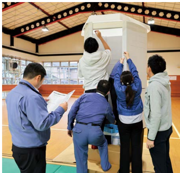
災害時に備えるため、組み立て手順を確認しました