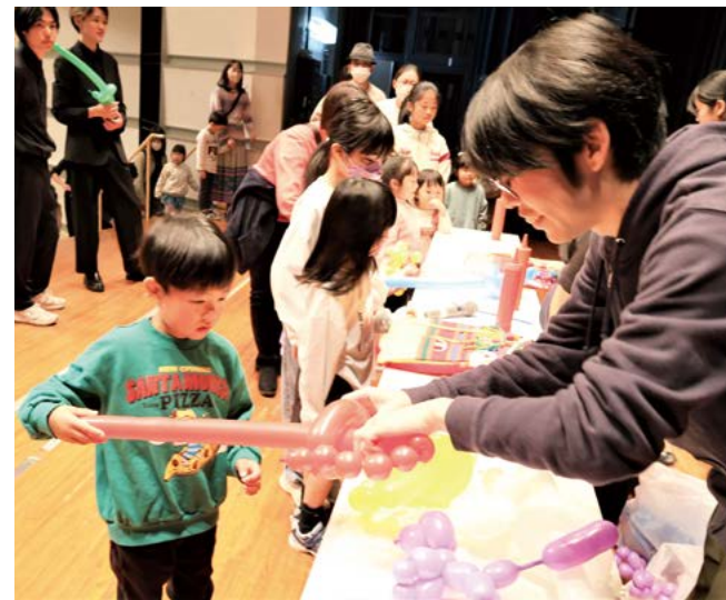
剣のバルーンアートを手に入れました