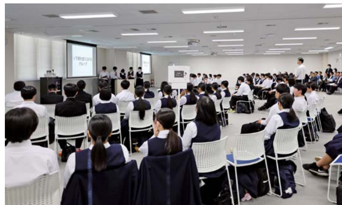
市長に対して、各チームから活発なプレゼンが行われました