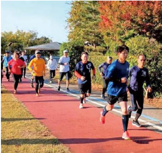
3周年記念の回も秋晴れのもと、駆け抜けました