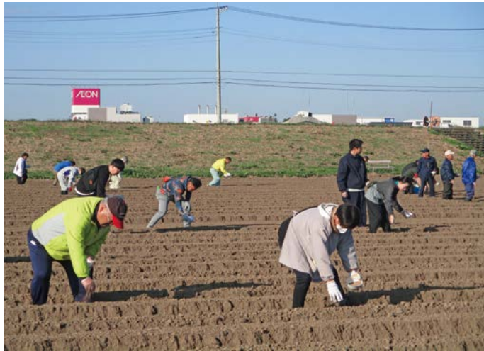
来年もきれいなポピーが咲きますように