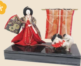
独引き官女 (明治中期～昭和初期)