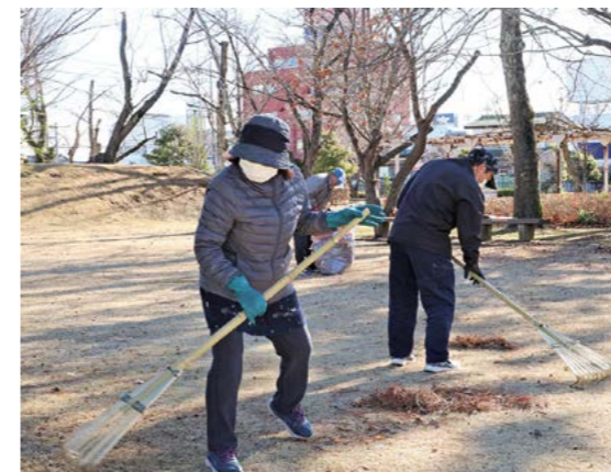
熱心に清掃に取り組みました(多賀谷城跡公園)

令和7年12月26日、市役所周辺と多賀谷城跡公園において、下妻地方広域シルバー人材センターの会員によるボランティア清掃活動が実施されました。