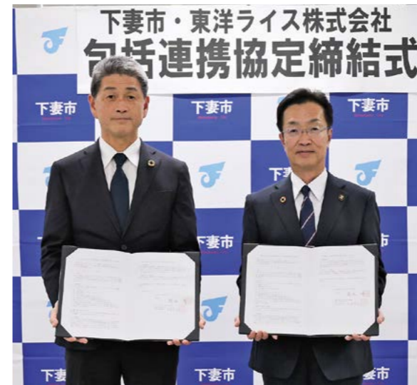
左から阪本代表取締役副社長、菊池市長