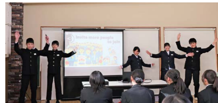
上：小学生による英語でのコミュニケーションの様子 下：英語による活発なプレゼンテーションの様子(東部中学校)