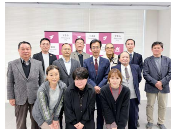
報告会に出席した委員の皆さん

3月10日、市役所において「下妻市庁舎周辺エリア整備検討市民会議」の報告会が開催され、基本計画策定に係る報告書が提出されました。この会議は公募市民や団体代表など32名の委員で構成され、当日は11名が出席しました。これまで、全5回の会議や先進地視察を通じ、次世代のためのエリア整備について検討を重ねてきました。