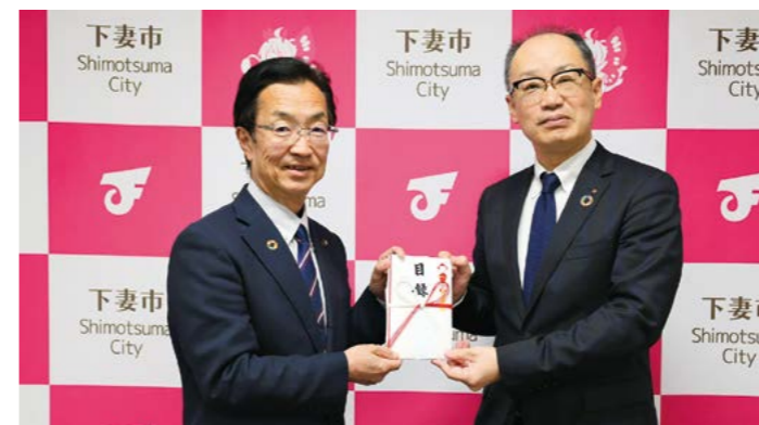
左から菊池市長、篠崎支店長 (寄贈当時)

3月13日、常陽銀行から、今春入学する市内9つの市立小学校の全新生徒に向けて、防犯ブザーが寄贈されました。