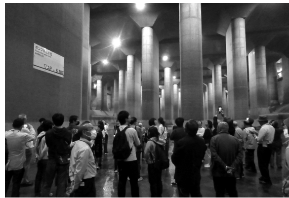
調圧水槽内の様子

続いて近年の気象状況を見てみると、下妻市は、平成27年9月発生の「関東・東北豪雨」、令和元年10月発生の「台風19号」で、多大な被害を受けました。また、全国各地で線状降水帯や短期的豪雨が頻りに発生しています。線状降水帯の発生頻度は、ここ45年間で2.2倍に増えていると言われています。