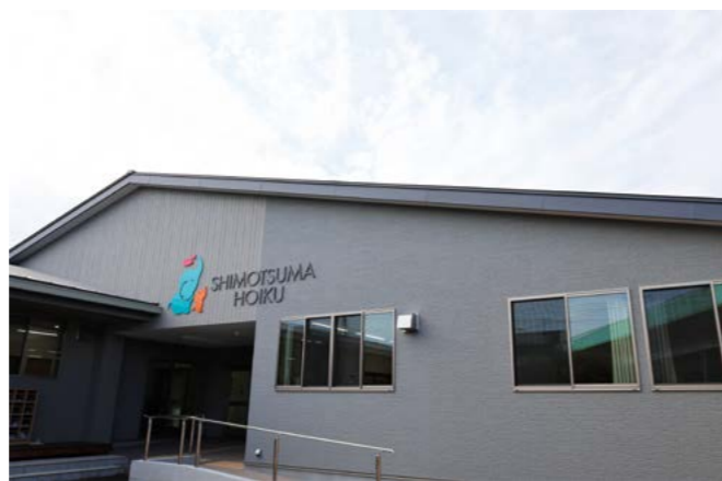
完成した下妻保育園の新園舎