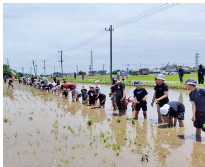
泥んこになりながら田植えを楽しむ子どもたち