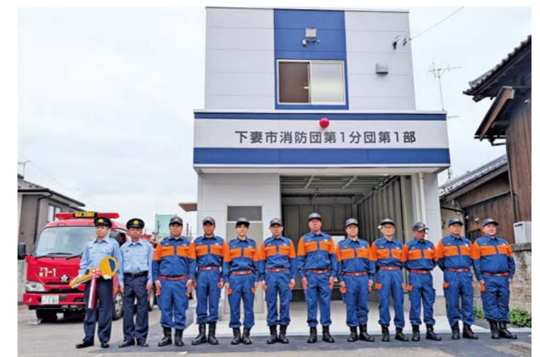
新詰所の完成で、地域防災力のさらなる向上が期待されます