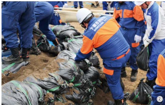
① 隊員協力によるスピーディーな土のうづくり ② 土のうを積み上げる月の輪工法