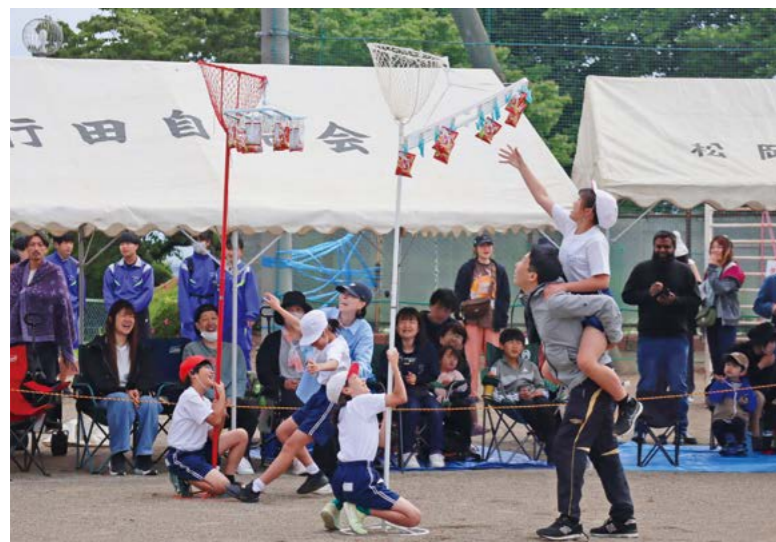
親子で力を合わせて (総上小学校にて)