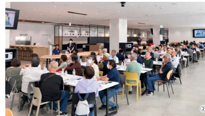
① マイタイムラインによる避難学習（千代川中学校） ② マイタイムライン講座（エスティローダー下妻工場）