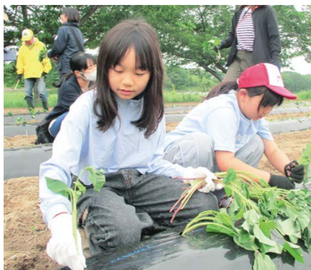
秋の「さつまいも掘り大会」を心待ちにしながら